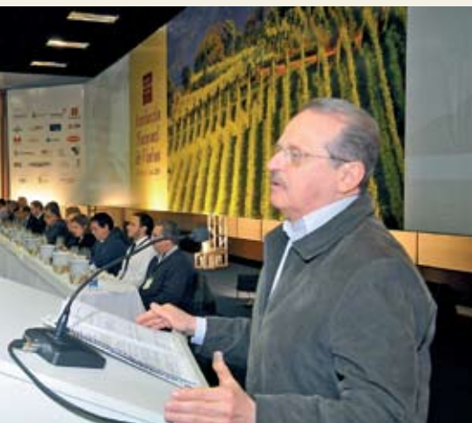
Governador Tarso Genro confirmou aumento de recursos para o setor