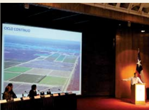
Palestra de Fábio Lenk