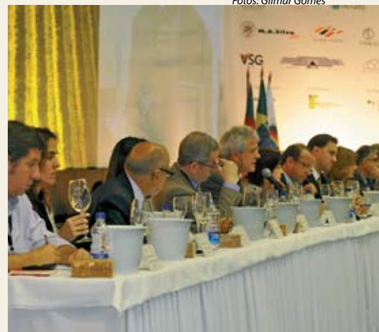
Amostras degustadas foram comentadas por 16 convidados especiais