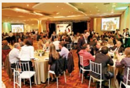
Mais de 200 pessoas participaram da festa dos enólogos