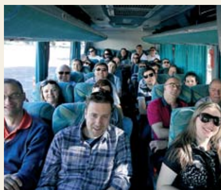
Grupo no ônibus