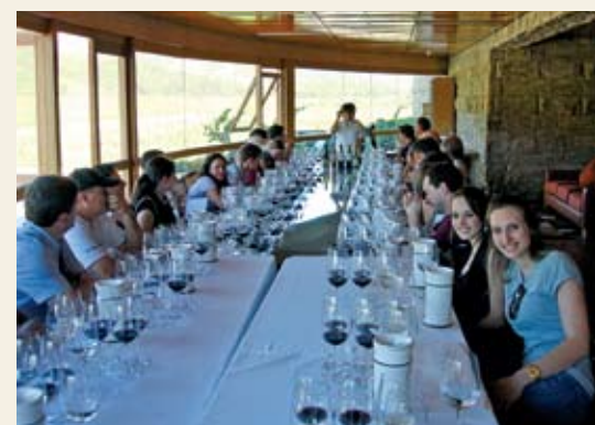
Degustação na Montes Alpha