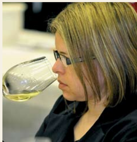
Apreciadores de vinho de todas as regiões brasileiras estiveram presentes ao evento