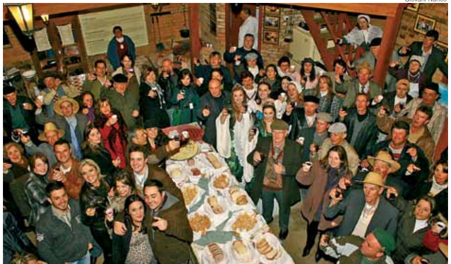
Brinde coletivo ao Dia do Vinho no Filó Italiano