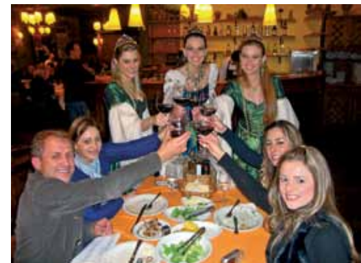
Soberanas do Vale percorrem os empreendimentos recepcionando os turistas