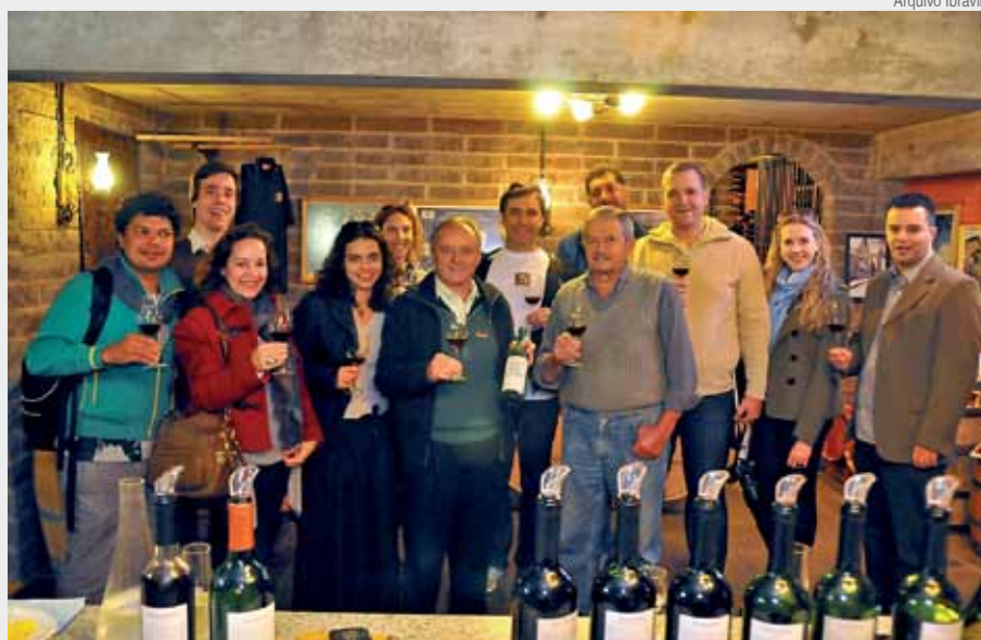
Jornalistas participantes do Projeto Imagem visitaram empresas associadas à Aprovale

Um grupo de 10 jornalistas da Bahia, Pernambuco e São Paulo estiveram visitando o Vale dos Vinhedos durante o período de realização da Fenavinho Brasil 2011. O Projeto Imagem, iniciativa do Ibravin, integra as ações de promoção do vinho brasileiro junto à mídia e formadores de opinião. O grupo teve a oportunidade de visitar diversas vinícolas do roteiro, conhecendo na origem a proposta do Vale dos Vinhedos, sua identidade e diferenciais. No período, o Vale dos Vinhedos também recebeu a visita de uma equipe da Revista Tam nas Nuvens que na edição de junho publicou,