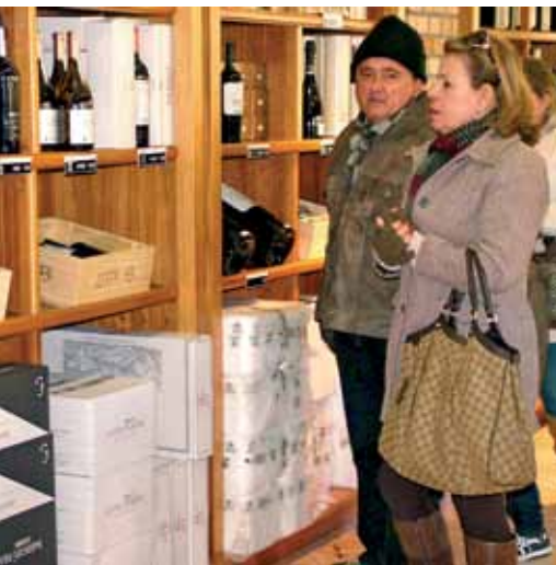
Turistas aproveitaram os descontos para comprar vinhos direto do varejo