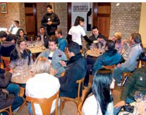
Cursos de degustação com turmas lotadas