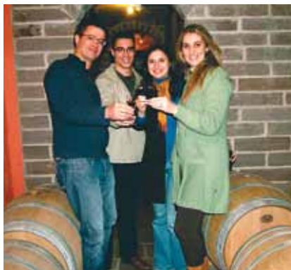
Brinde entre amigos entre uma visita e outra