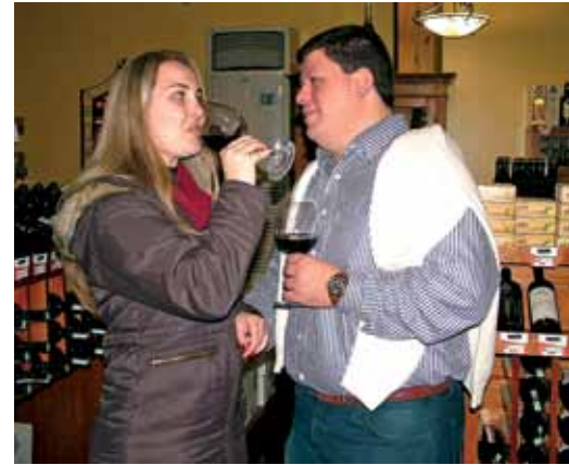
Casal de Curitiba aproveitou a programação para degustar vinhos do Vale dos Vinhedos