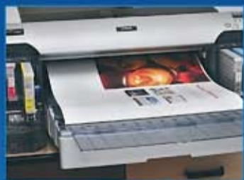
Prova de cor digital