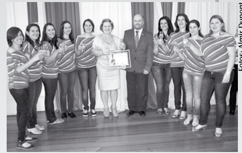
Equipe das Lojas Carlize

Na avaliação, a satisfação dos clientes e colaboradores não pode ser inferior a 70%. Empresas interessadas em participar podem ingressar no programa a qualquer momento. Mais informações no site Q Comércio - www.qcomercio.com.br .