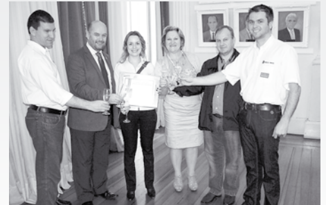
Equipe da Modelo Pneus